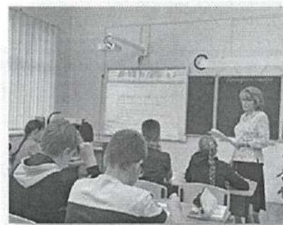
Формирование читательской грамотности на уроке русского языка в 6 классе