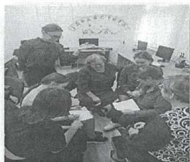
«Своя игра» на уроке геометрии в 9 классе