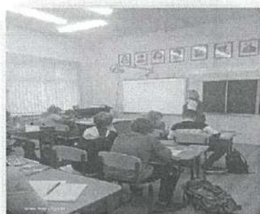
Открытый урок биологии в 6 классе