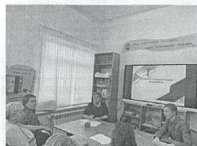
Семинар по теме «Формирование функциональной грамотности учащихся»