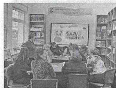
Командная викторина среди педагогов «Баттл ФГ»